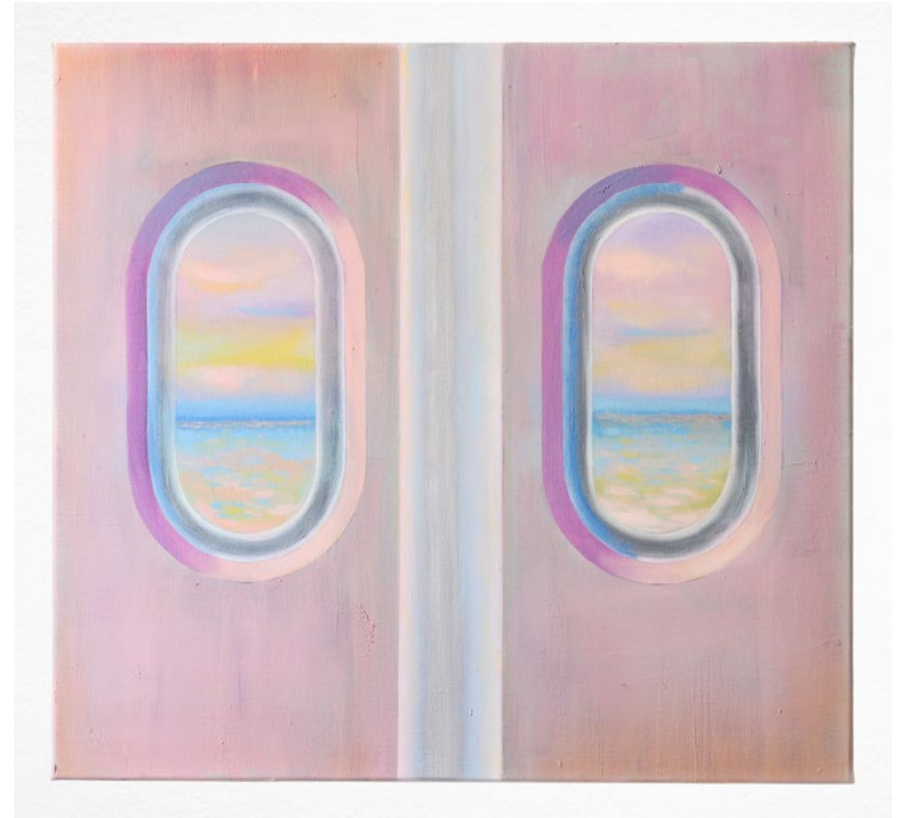
Diorama (2023) oil and aluminum on linen, 50 x 54 cm