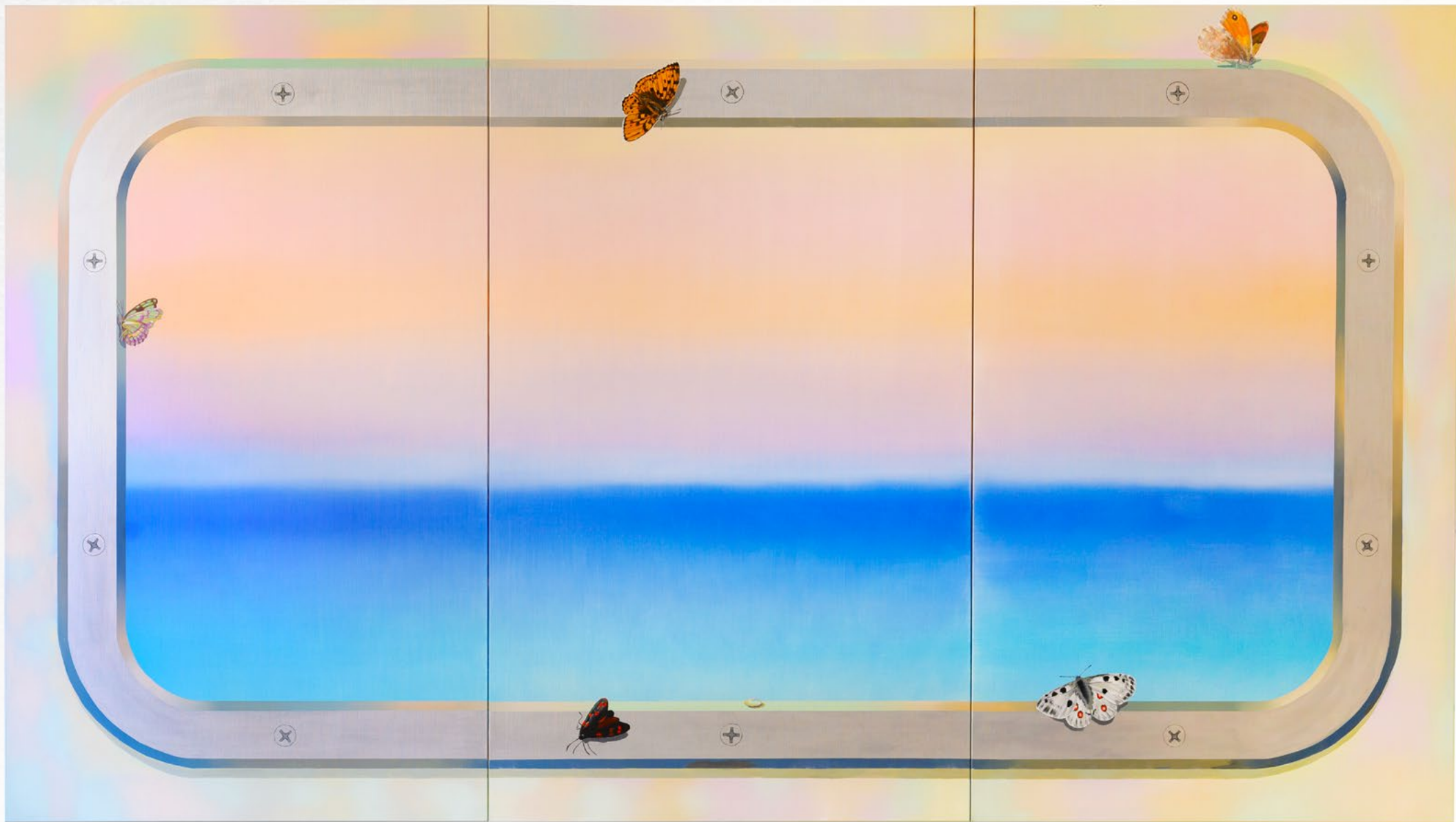
Panorama (2023) oil and aluminum on linen, 170 x 300 cm