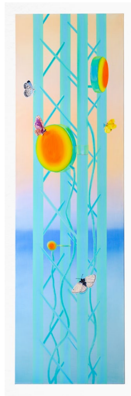
Internally inconsistent (2023) oil on linen, 170 × 50 cm

The plants that painters have relied on for material for centuries all need sun, wind, and water. The most essential of them have been linen – for weaving canvas – and olive oil, which is mixed with pigment to make oil paint. In the series Minijobs , Astrid Kajsa Nylander refers to the textile qualities of