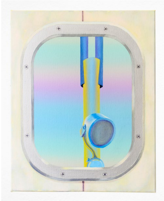
Bounce (2023) oil on linen, 50 x 40 cm