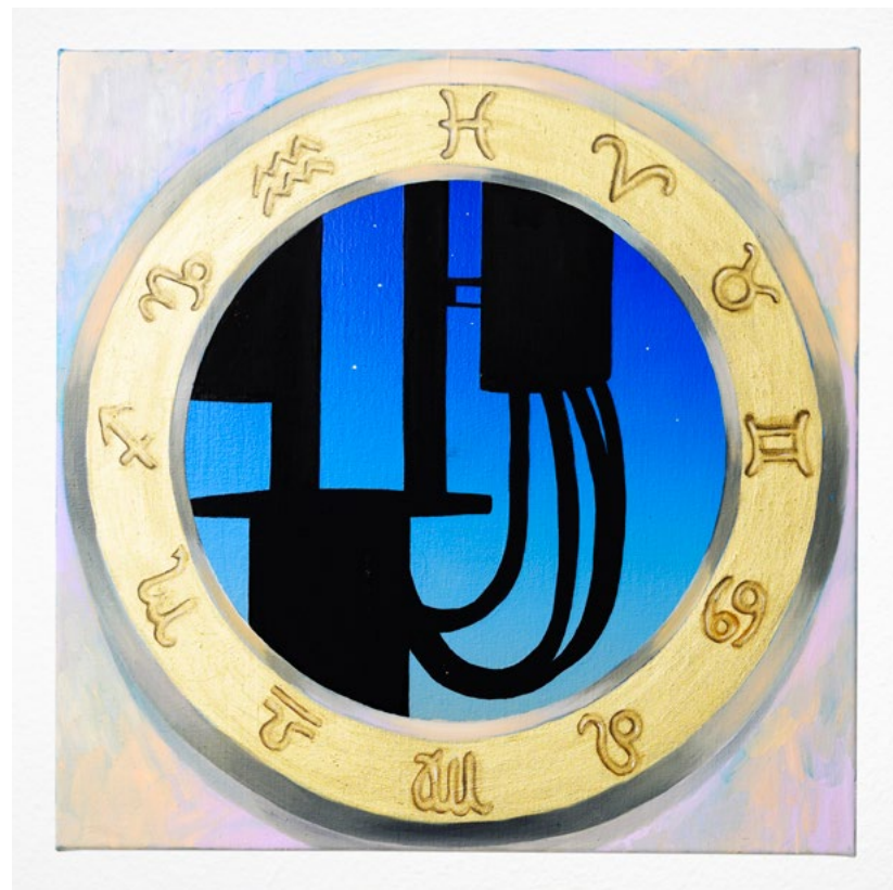
Compatibility (2023) oil and bronze on linen, 50 x 50 cm