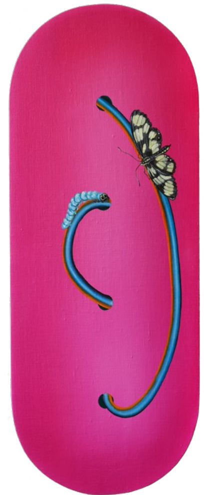
pink minijob #7 (2023) oil on linen 65 x 25 cm