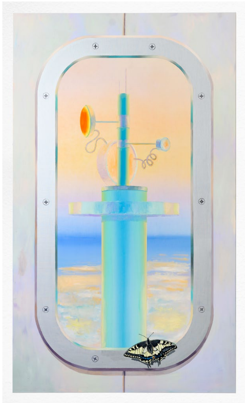
Macaoon (2023) oil and aluminum on linen, 170 × 100 cm

Anchers Promenad på stranden från 1896. En nutida parallell finns förstas i skärmens ljusstarka bilder, upplysta bakifrån – och med oemotståndlig dragningskraft.