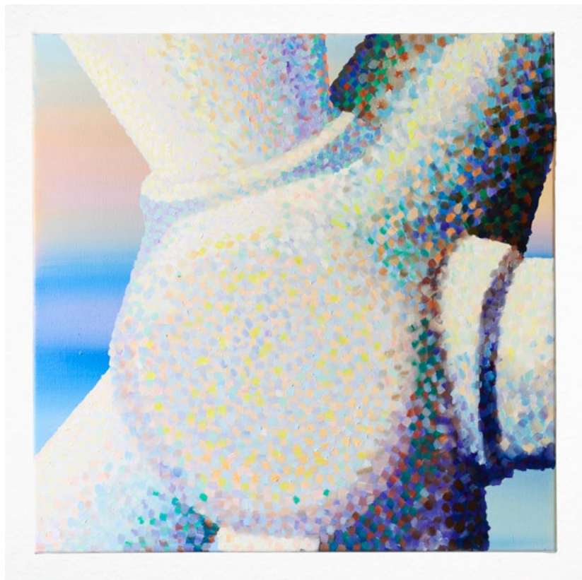
Crop #1 (2023) oil on linen, 50 x 50 cm